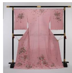
か が ゆうぜん 加賀友禅