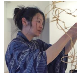
|大分県| べっ ぶたけせいひんきょうどうくみあい 別府竹製品協同組合