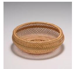
べっ ぶたけざい く 別府竹細工