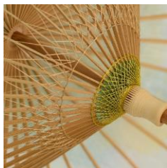
ぎ ふわがさ 岐阜和傘