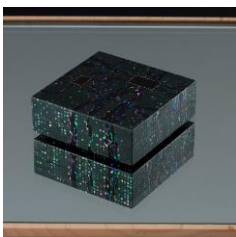
まさえ らでん 時絵・螺鈿