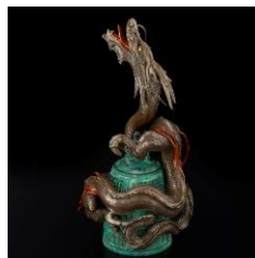
わじま かわりぬり 輪島の変塗