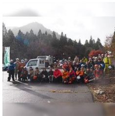
|岐阜県| エゴニキプロジェクト 実行委員会