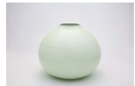
〈代表作品〉 黄磁釉 花瓶（菊）

〈講評〉九谷焼の伝統工芸士。気品に満ちた作風は若手の信望も厚く、異業種とのコラボでも脚光を浴びている。その技術を継承するべく40年前の独立時より弟子をとり、職人を多教育成。さらに、若手作家を対象に自工房で研修を行うなど、後継者育成に力を注いでいる。また、県の工業試験場と磁器坏土（はいど）を共同開発するなど、原材料の確保や道具、機器の改良にも尽力。こうした九谷焼の発展を支える地道で幅広い活動が評価された。