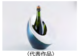
〈代表作品〉 鋸起和器 MOON

〈講評〉燕鋸起銅器を200年に渡って受け継ぐ老舗の後継者として、海外ブランドとのコラボレーションや異業種との新製品開発などに尽力。自分たちで作った製品を自らの手で丁寧に販売するという信念を軸とした、百貨店との直接取引や直営店舗設立といった流通機構改革への実績が評価された。また、終業後は工場を職人に開放し、若手の技術訓練やベテランの作品創作にチャレンジする場として提供するなど、若手育成や技術力向上の環境を整え、世界最高峰を自負する技術・技能継承へのきめ細かな就業体制を作っている。