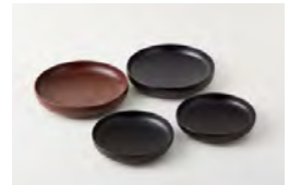
〈代表作品〉 蒔地小福皿、千すじ小福皿

〈講評〉江戸後期から続く漆器業の7代目。分業主流の輪島塗産地で、先駆けて木地、漆塗りの一貫生産を実現し、消費者ニーズへの対応に努め、長年にわたって産地の改革と活性化に取り組んだ実績が評価された。現代の様々な生活シーンに馴染む漆器や家具、建築内装材を国内外へ幅広く提案している。さらに、産地内の若手、中堅、漆芸研究所生徒等40数名を集めた「輪島クリエイティブデザイン塾」などの事業を推進し、後継者育成にも尽力している。